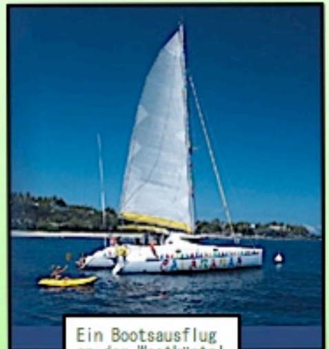
Ein Bootsausflug an der Westküste!