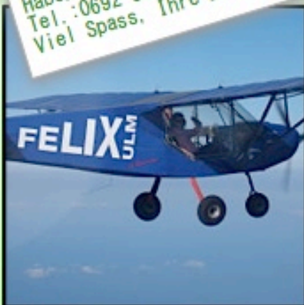
Ein absolutes Highlight: der Flug mit dem Ultraleichtflieger